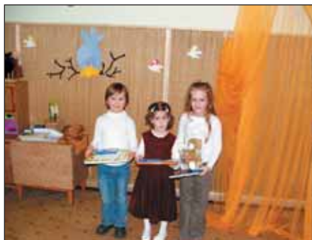
Mese- és versmondó verseny győztesei