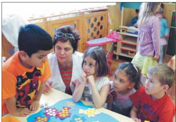
Rákóczi u.-i óvoda „Nyuszi” csoportosai ismerkedtek a vízi világgal