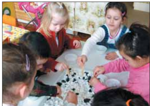
Verseny: ki tud több jó fogat gyűjteni?