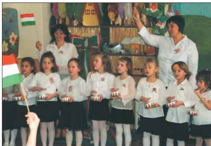
Március 15-i ünnepség a „Katica” csoportban