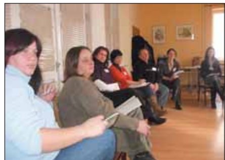
A szülők is szeretnék elsajátítani a konfliktuskezelést

foglalkozásokon olyan technikákat sajátítanak el a gyermekek, melyek segítségével konfliktusaikat agressziómentesen tudják megoldani. Játékos formában fejlesztik a gyermekek önismeretét és önbecsülését. Az egymásra fordított figyelem fejlesztése fontos része a tréningnek.