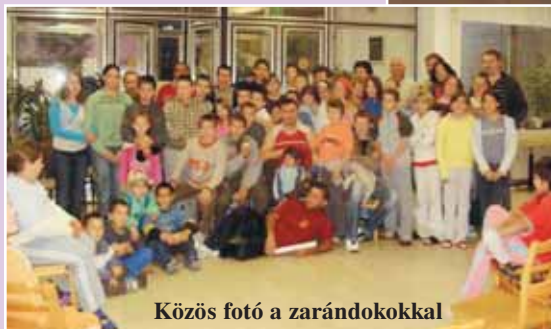
Közös fotó a zárandókkal

denkinek ahhoz, hogy el tudja felejteni kicsit a gondjait, és önfeledten lehessen gyerek a gyerekekkel.