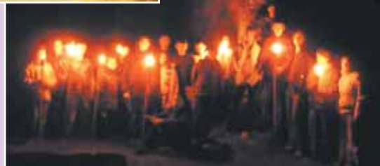
Fáklyás felvonulás a Pusztatemplomnál

csak a letisztult érintetlenség. Azt gondolom, aki résztvevője volt ennek a "csodának", csak táplálkozhat abból, amit itt látott és hallott. Sok ilyen estére lenne szüksége min-