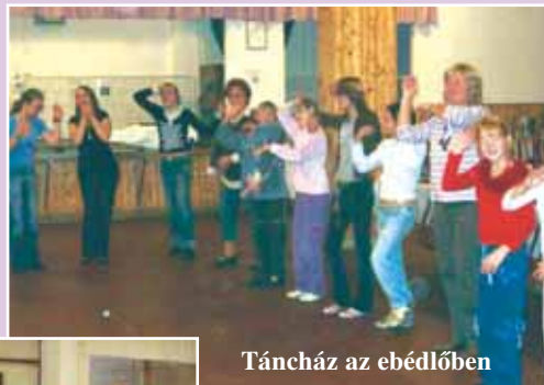
Táncház az ebédlőben

Már ekkor érezhető volt a gyerekeken, hogy megérintette őket az a szellemiség és pozitív sugárzás, amit e messziről jött emberek hoztak. A varázslat azonban csak ezután kezdődött. Előkerült a gitár és a szájharmonika, és olyan hangulatot teremtett a zene, melyet emberi kezek mesteri szervezésével sem tehettek volna. Az összetartozás, a bizalom és a szeretet hangjai voltak ezek, ahol eltűntek a különbségek ember és ember között, és nem maradt más