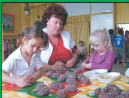
A Méhecske csoportban gyurmából és napraforgómagból formás kis süniket készítettek az óvodások.