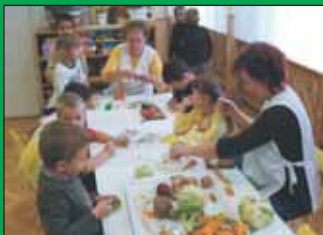
Az Őzike csoportban az őszi termékekből csodálatos alkotások kerültek ki a gyermekek kezei közül