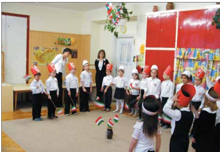
A Központi óvoda Napocska csoportosai ünneplőbe öltözve emlékeztek meg 1848 március 15-ről