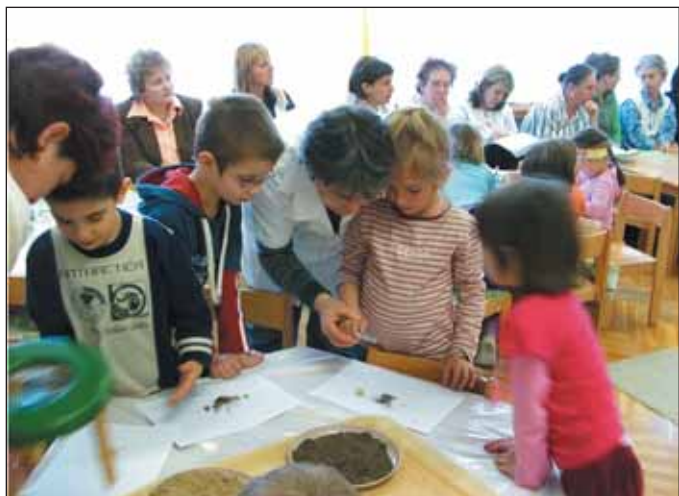
A gyermekek nagyítóval vizsgálják a talaj szerkezetét

Óvodánkban 4 fő szakvizsgázott fejlesztőpedagógus dolgozik, akiknek feladata a Nevelési Tanácsadóból és szakértői bizottságból visszaérkezett jellemzések alapján a gyermekek egyéni, illetve kiscsoportos fejlesztése. A fejlesztő foglalkozások célja a képességek korai fejlesztése, a tanulási képességek megalapozása, javítása, a tanulási és egyéb rész-képesség-zavarok kialakulásának megelőzése, illetve azok kezelése. Hiszen a gyermekek adottságaitól, biológiai érésüktől függően képességüket tekintve eltérően fejlődnek. Ezeknek a gyermekeknek heti 2 alkalommal biztosítjuk a fejlesztő foglalkozást kb. 30 percben. A foglalkozások egyik felét a mozgásfejlesztés teszi ki, melyet hétfő délutánonként tartunk a gyermekek számára, hiszen a mozgás minden további képesség fejlesztésének alapja.