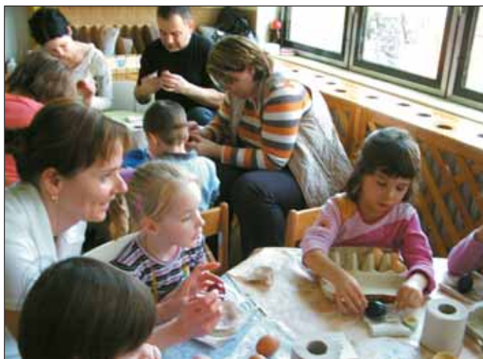
Tojásfestés a Mécses Csoportban