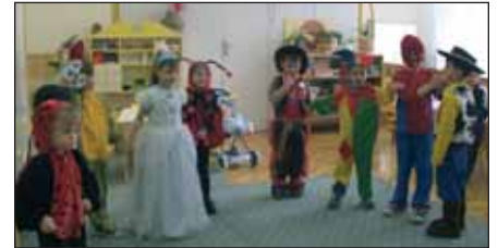
Az Őzike csoportosok vidám farsangi mulatozása