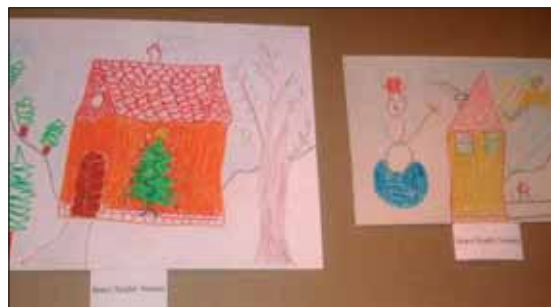
Néhány a nyertes rajzok közül