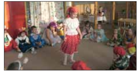
A gyermekek érdeklődéssel figyelték a Napocska csoportban társuk jelmezes bemutatkozását