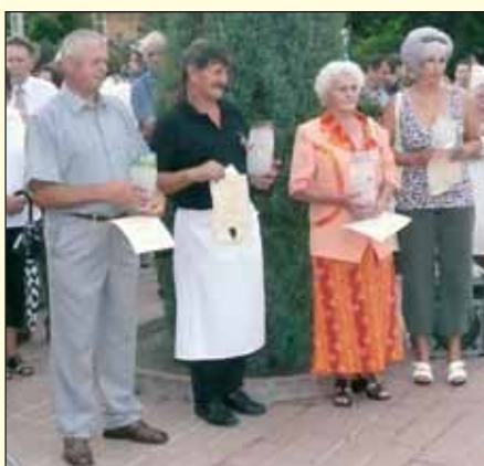
A Falunapi Szép kert, szép környezet környezetcsépitő verseny díjazottjai