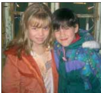
A két győztes