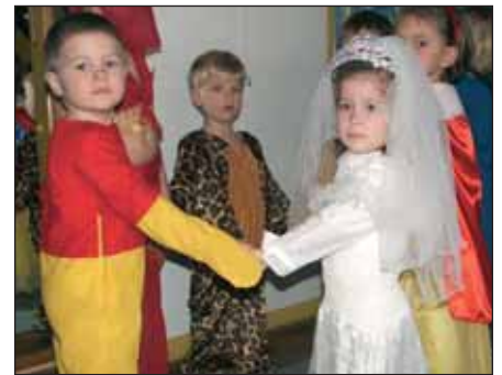
A Napraforgó csoport győztes táncpárja