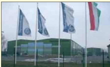
Megkezdte működését a ThyssenKrupp Építőelemek Kft. felsőlajosi gyára

Tájékoztatjuk a tisztelt Lakosságot, hogy kísérleti jelleggel a menetrend szerinti járatokon kívül autóbuszjáratok indultak