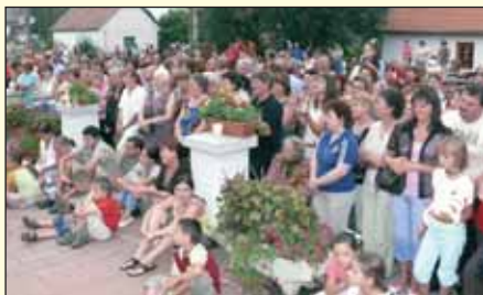
Nagy sikert aratott az V. alkalommal megrendezett falunapi rendezvény