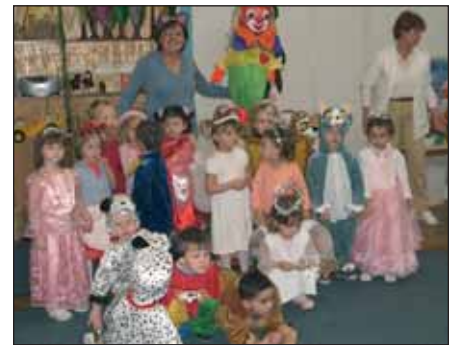
A kis Katicák vidáman búcsúztatják a telet